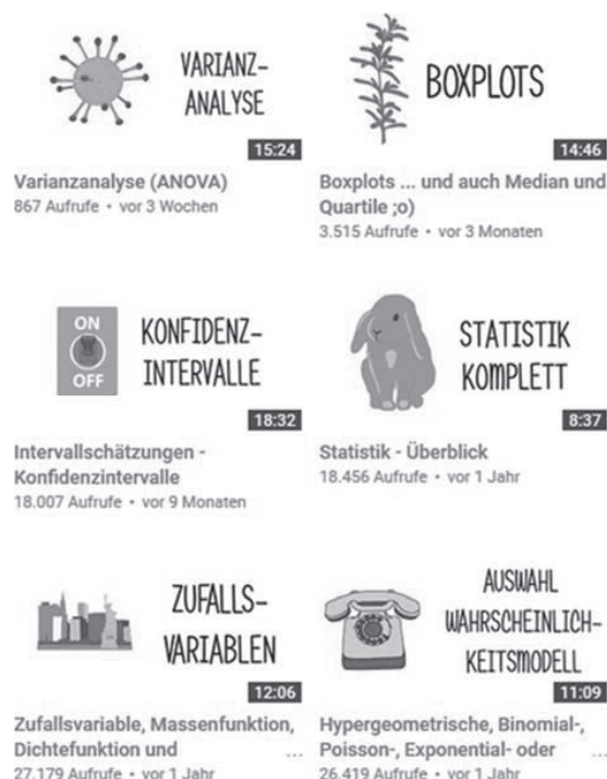
Abb. 1: Einige Videos aus dem YouTube-Kanal Kurzes Tutorium Statistik

probenverteilungen und Konfidenzintervallen (s) ein Konzept vor, den Stochastikunterricht in der Sekundarstufe II mittels Computereinsatz verständnisorientiert zu gestalten. Dieser Ansatz wird von ihm in Niedersachsen seit vielen Jahren sowohl im Unterricht als auch in der Lehrerfortbildung erfolgreich umgesetzt und weiterentwickelt. Insbesondere komplexe Themen wie Stichprobenverteilungen oder Prognose- und Konfidenzintervalle werden durch die konsequente Visualisierung begrifflich leichter fassbar.