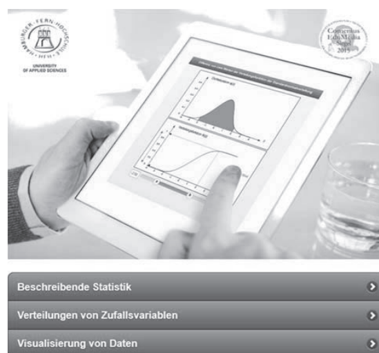
Abb. 3: Web-App Statistische Methoden und statistische Daten – interaktiv

Am Sonntagvormittag berichtete Rolf Biehler über Stochastik kompakt – Eine Fortbildungsreihe zum GTR-unterstützten Stochastikunterricht in der Sekundarstufe II , die im Rahmen des Deutschen Zentrums für Lehrerfortbildung in Mathematik (DZLM) mit und für Lehrkräfte in Nordrhein-Westfalen und Thüringen konzipiert und weiterentwickelt worden ist. In der viertägigen Fortbildung wird Lehrkräften technisches und didaktisches Wissen zum GTR-Einsatz vermittelt. Die behandelten Beispiele umfassen Simulationen, die Berechnung und Veranschaulichung von Verteilungen sowie interaktive Visualisierungen